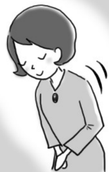
ゆっくり頭を下げて ゆっくり上げることを 意識しましょう

に見えるためには大切。最後まで丁寧に振る舞うことで、「また会いたい」と思われる人に。「失礼します」「また会いましょう」などとあいさつして別れたら、一度振り返りましょう。相手は入り口などで見送っていることも。振り返ったときに目が合ったら、ほほえみながら軽く会釈をします。そのあと、気を抜かず背筋を伸ばして歩きましょう。背中が丸まっている、歩き方ががさつなど、後ろ姿が美しくないとよい印象を残せません。